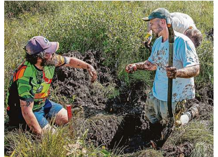
Špinavá práce Před zatloukáním dřevěných základů je třeba v rašelině vykopat půl metru hluboký příkop. Práci nejčastěji brzdí staré kořeny stromů.

Od nedaleké silnice vedoucí z Dobré k Černému Kříž se trousí dobrovolníci s dřevěnými latěmi na ramesnou. Do večera se musejí podle plánu dostat až ke korytu Teplé Vltavy. „Jen v lokalitách pod osadou by měli postavit dohromady okolo 200